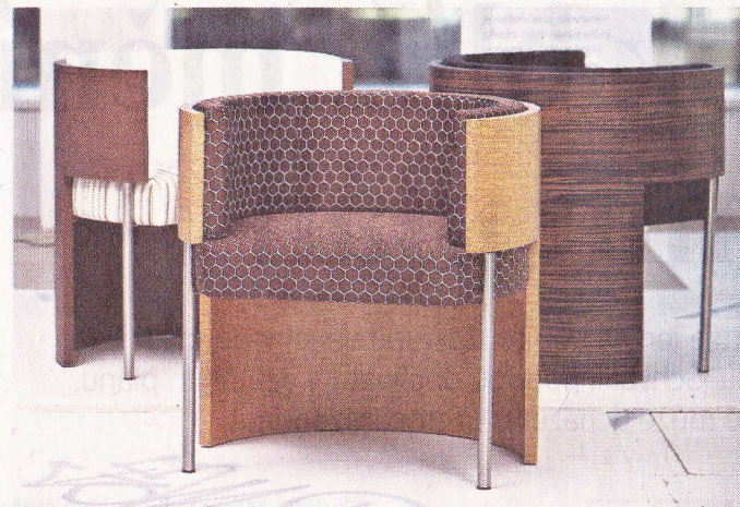
Bambolo Různé varianty oceněného křesla.

K designu sice pořádně přičichl až na střední škole, vyrůstal však v rodinné nábytkářské firmě, a proto mu vybavení interiérů úplně cizí není. Navíc navrhování věcí do domácnosti ho baví čím dál víc. „Ve třetím a teď ve čtvrtém roční-